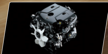
Motor a Diesel 2.8 L 16V Turbo