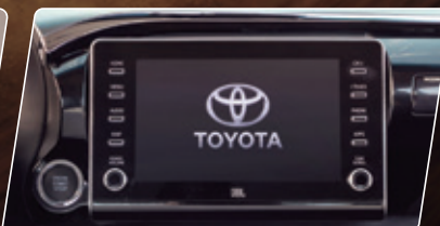
Sistema multimídia de 8", conectividade Apple CarPlay® e Android Auto®**