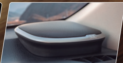
Sistema de áudio JBL com subwoofer e 8 alto-falantes*